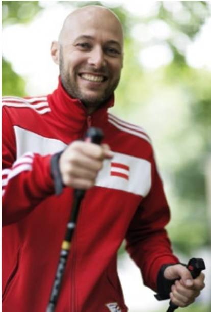
MANN bleib gesund.

Das Auto ist des Mannes liebstes Spielzeug und wird entsprechend gepflegt und gewartet – und was macht er für sich selbst? Nehmen wir es gleich vorweg: Männer sind Vorsorgemuffel. Gerade einmal 20 Prozent aller Männer können sich zu einer Vorsorgeuntersuchung und der Möglichkeit zur Krebsfrüherkennung durchringen. Vielleicht ein Grund, warum die Lebenserwartung des „starken Geschlechts“ statistisch gesehen mehr als 5 Jahre unter der von Frauen liegt?